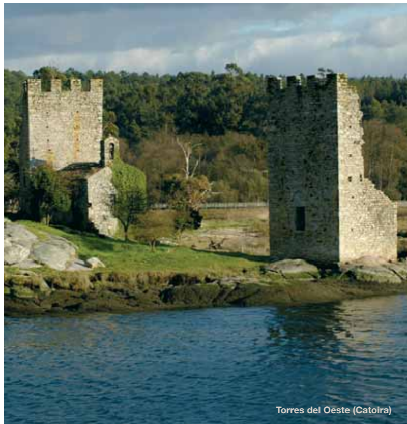
Torres del Oeste (Catoira)

Valga se encuentra siguiendo el curso del Ulla hacia su desembocadura. Podemos encontrar iglesias y capillas de interés cultural y arquitectónico: la capilla de los Martores, cuya primera construcción data del siglo IV, las Iglesias de Santa María de Xanza, Santa Comba de Louro y Santa Cristina de Campaña (s.XVI), en cuyo interior alberga admirables retablos del siglo XVIII, pinturas y curiosidades del estilo románico en Galicia.