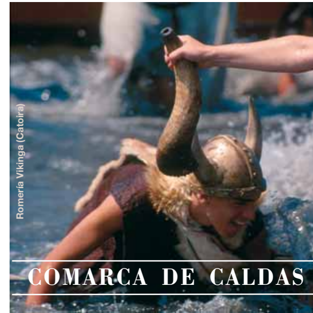
Romería Vikinga (Catoira)