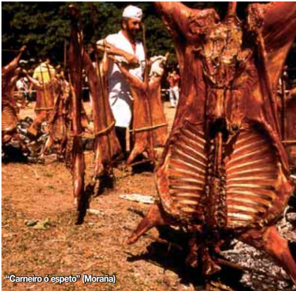
"Carneiro ó espeto" (Moraña)