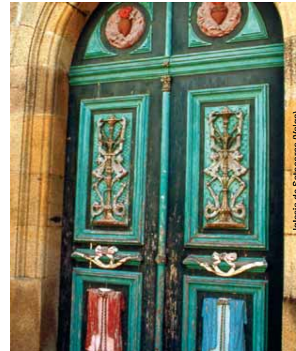
Iglesia de Setecoros (Valga)

Valga: Panorámica de 22 kms con posibilidad de visitar molinos, iglesias y puentes romanos, así como el itinerario Botánico-Forestal de Monte Beiro, con 40 especies arbóreas.