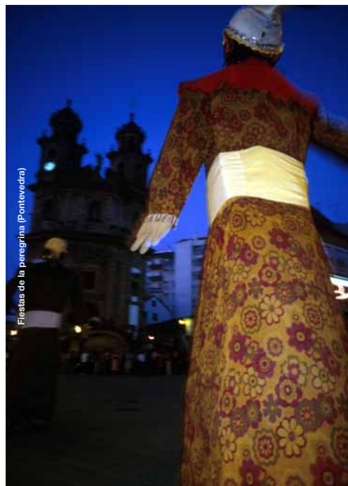
Fiestas de la peregrina (Pontevedra)

La comarca de Pontevedra, formada por los ayuntamientos de Pontevedra, Poio, Barro, Campo Lameiro, Cotobade, Vilaboa, Ponte Caldelas y A Lama se encuentra situada entre el fondo de la ría de Pontevedra y la zona interior de montaña de la Sierra do Suído.