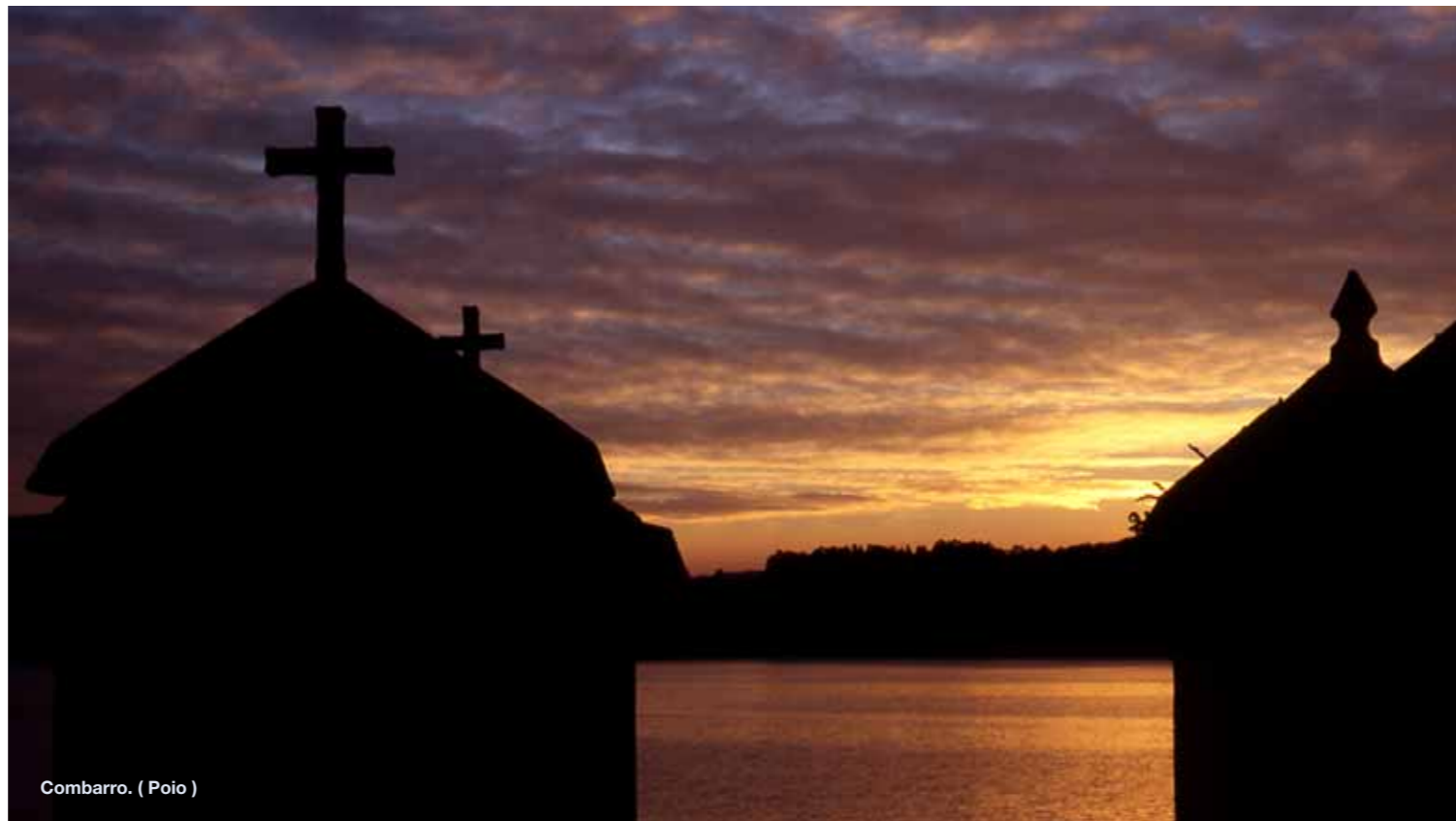
Combarro. ( Poio )

¶ En Vilaboa , municipio cargado de historia, podemos destacar el Hórreo de San Adrián , el segundo más largo de Galicia, que junto con los palomares, el buen estado de conservación de algunas viviendas y los restos del Castillo de Ubeiras nos dan una idea del antiguo poderío en la zona. Es muy rico en patrimonio natural como las Salinas del Ullóo , la ensenada de San Simón o el Paraje de Coto Redondo , en el que podemos disfrutar del Lago Castiñeiras , cuyo entorno ha sido declarado Espacio Natural Protegido debido a su variedad en flora y fauna.