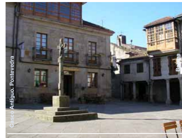
Casco Antiguo. Pontevedra