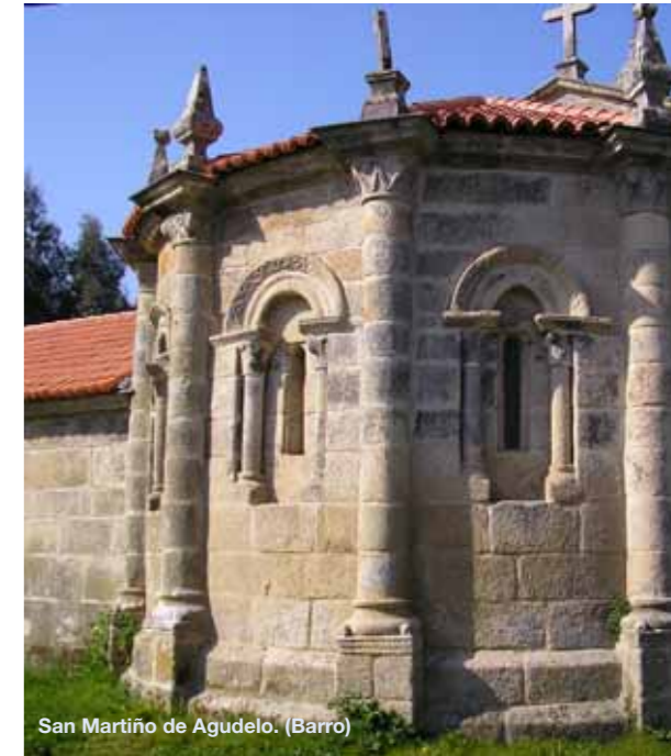
San Martiño de Agudelo. (Barro)

Ocupa varios edificios de gran importancia en la ciudad, en él destacan colecciones de arqueología, azabaches, pintura española y extranjera, cerámica, grabados prehistóricos, alfarería popular, arte gallego, etc., además posee una rica biblioteca especializada, hemeroteca y archivos.